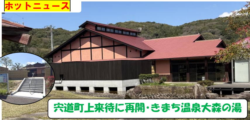
宍道町上来待に再開・きまち温泉大森の湯