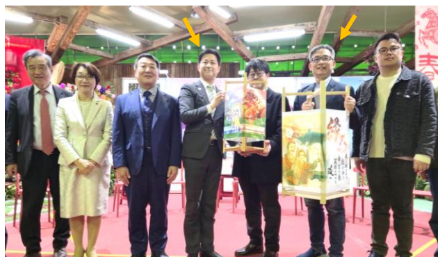
上定市長（左）と張温徳（右） ようおんとく）台北市副市長 が両市の友好協力を約束！

毎年、台湾の春節に合わせて「春節前建国花市」に、松江市が大根島のボタンを展示する催しに参加しています。今回、その中で台北市とその関係者や台湾政府・経済部傘下のTJPO(ティー・ジェー・ピー・オー)という台日産業連携推進オフィスの方々との商談会に上定昭仁市長や細木明美副議長と共に参加しました。